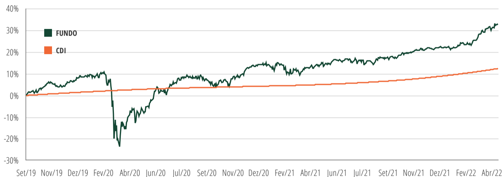
RENTABILIDADE X BENCHMARK

UTILIZAÇÃO DE RISCO - Limite de Stress: 40pts | em 18/04/2022