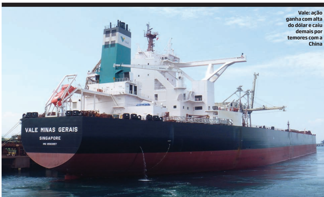
Vale: ação ganha com alta do dólar e caiu demais por temores com a China

Vale (mineração): os analistas do HSBC destacam que quase 100% da receita da mineradora estão em dólar, enquanto 54% dos custos dos produtos da empresa são em reais, o que beneficia a Vale diante da elevação da moeda norte-americana. Eles afirmam que, nos atuais preços, a ação embute um cenário negativo para o crescimento da China e para os preços do minério de ferro, em contraste >>>