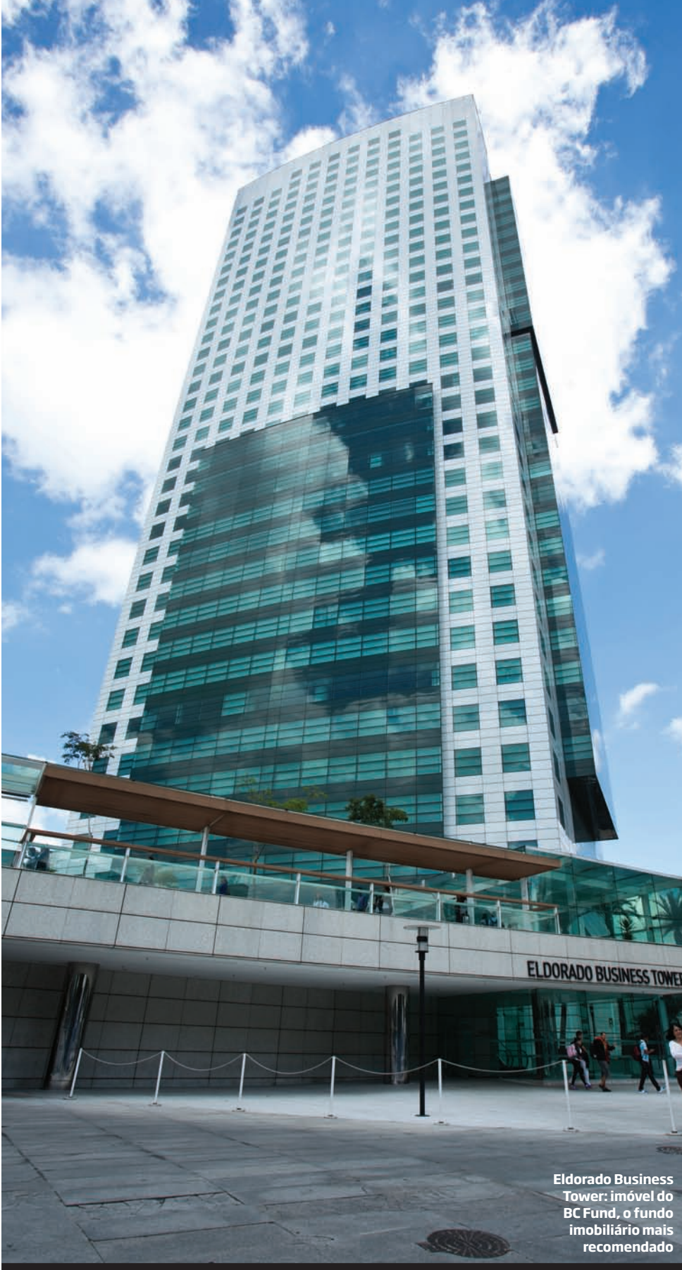
Eldorado Business Tower: imóvel do BC Fund, o fundo imobiliário mais recomendado

leiras e talvez até mesmo a abertura de uma empresa no exterior para planejamento tributário. Uma forma mais simples de investir em ações de empresas norte-americanas é por meio dos BDR Nível 1 Não Patrocinados negociados na BM&FBovespa. Atualmente estão disponíveis papéis de 70 empresas, como Apple, Google, 3M e Goldman Sachs. No entanto, o pequeno investidor não consegue investir diretamente nesses títulos - a aplicação só está disponível para pessoas físicas com patrimônio de mais de 1 milhão de reais em aplicações financeiras. Outra opção é usar fundos de investimento em BDR. Um dos poucos fundos que faz isso é o Bradesco FIA BDR Nível 1, que nos últimos 12 meses rendeu quase 40%, liderando o Ranking InfoMoney de fundos de ações no período. "Temos 32 papéis, com foco em empresas dos setores de tecnologia e farmacêutico, além de um pouco de bancos", explica o diretor de estratégia da Bradesco Asset Management, Joaquim Levy. O gestor recomenda o fundo como um instrumento de diversificação, para aproveitar movimentos de alta do dólar, além de participar do crescimento de grandes empresas estrangeiras. Mas o investidor não deve esperar um retorno tão elevado quanto o dos últimos 12 meses.